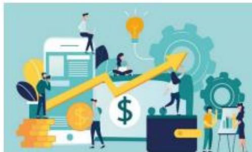
Gambar 2. Ekonomi

Ekonomi adalah kegiatan yang bertujuan memenuhi kebutuhan ( need ) dan keinginan ( wants ) untuk meningkatkan kualitas kehidupan manusia. Hal ini menggambarkan bahwa kualitas kehidupan manusia sangat dipengaruhi oleh kegiatan atau fenomena ekonomi yang terjadi dimasyarakat tersebut.