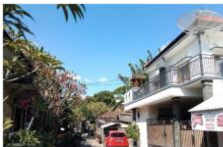
Gambar 1. Desa

Desa didefinisikan sebagai suatu tempat atau daerah dimana penduduk berkumpul dan hidup bersama, mereka dapat menggunakan lingkungan desa untuk mempertahankan, melangsungkan, dan mengembangkan kehidupan. Dalam pengertian tersebut tersirat tiga unsur yaitu daerah atau tanah, penduduk, dan tata kehidupan (Bintarto, 1977).