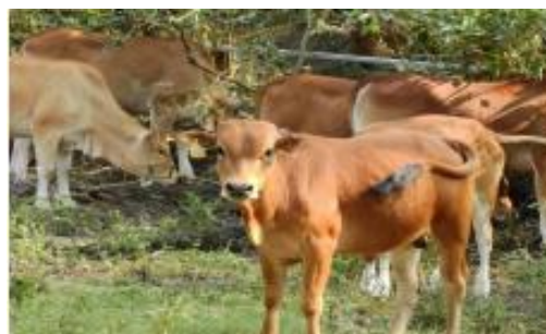
Gambar 3. Hewan Ternak

Program KDRT (Program Kelompok Desa Rawat Ternak) sebagai Wujud Penguatan Ekonomi Masyarakat di masa Pemulihan Ekonomi Nasional merupakan sebuah program yang ditujukan kepada masyarakat pedesaan. Program ini memberikan kesempatan kepada masyarakat untuk ikut serta berperan aktif dalam pengelolaan dana desa.